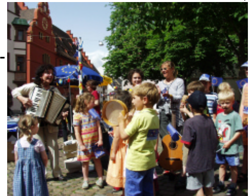
Europafest mit Musik und Information auf dem Freiburger Rathausplatz am 9. Mai 2003

Auch das jährlich stattfindende Euro-pafest auf dem Rathausplatz Freiburg lockte bei strahlendem Sonnenschein wieder viele hundert BesucherInnen an.