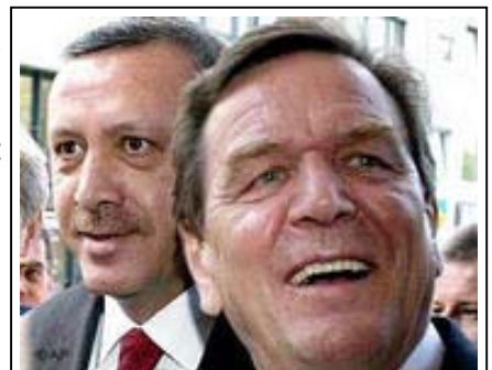
Bundeskanzler Gerhard Schröder mit dem türkischen Ministerpräsidenten Recep Tayyip Erdogan.

Die Befürworter erinnern dagegen nicht nur daran, dass sich die Türkei in einem umfassenden Reform- und Modernisierungsprozess befindet, sondern sie weisen auch darauf hin, dass die europäische Gemeinschaft den Türken mehr als vier Jahrzehnte begründete Hoffnungen gemacht hat und die Regierung Kohl im Dezember 1997 ausdrücklich „die Perspektive der Mitgliedschaft“ zuerkannte. Die gegenwärtige Grundsatzdebatte wäre vor 1999 angebracht gewesen, bevor die Türkei den Kandidatenstatus erhielt. Außenpolitisch liegen zudem die geostrategischen Vorteile auf der Hand: Die Stabilisierung der Länder im Bereich des östlichen Mittelmeers, den angrenzenden Regionen des Mittleren Ostens, des Kaukasus und der Balkanregion überwiegen eindeutig die vermeintlichen Nachteile. Die Entscheidung für die Aufnahme der Verhandlungen ist gefallen, die Diskussion um die Richtigkeit dieser Entscheidung wird den Prozess der kommenden 10 bis 15 Jahre begleiten. Zweifelsohne wird die Türkei diese Zeit auch benötigen, um den wirtschaftlichen Reformprozess erfolgreich abzuschließen und ökonomisch fit für den Beitritt zu sein.